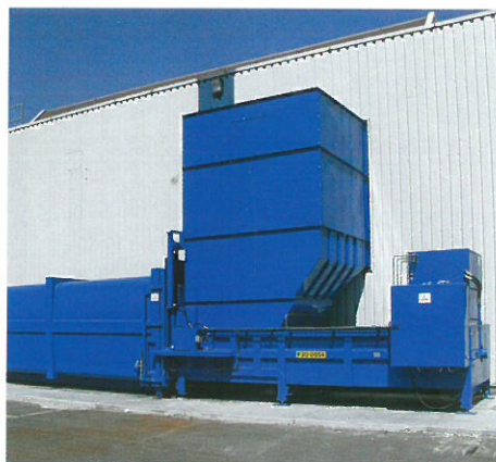
Prasy stacjonarne mogą współpracować z wymiennymi kontenerami dla wszystkich stosowanych systemów wywozu odpadów. Na zdjęciu urządzenie z zasypem przy ścianie obiektu.

mykania małych, nieprzystosowanych do tego magazynów i tymczasowych składowisk. W konsekwencji zbierane na danym terenie odpady muszą być transportowane do oddalonych o kilkadziesiąt kilometrów sortowni, spalarni, zakładów recyklingowych itp. Z uwagi na relatywnie niewielką ładowność zastosowanie w tym celu zwykłych śmieciarek jest nieoptyczne, a ponadto na wiele godzin wyku-